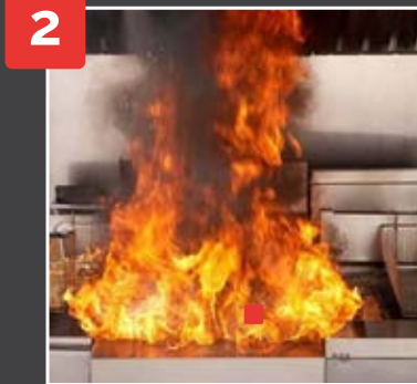
АКТИВАЦИЯ СИСТЕМЫ КУХМИСТЕР ВРЕМЯ = 15 СЕКУНД